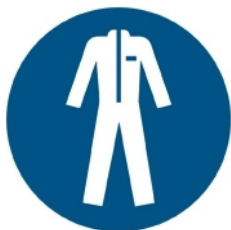
M010 - Indossare indumenti protettivi