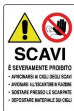
Divieto di accedere o sostare in prossimità di scavi