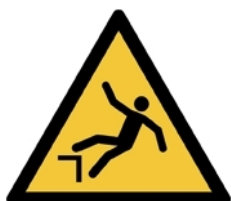
W008 - Caduta con dislivello