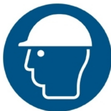
M014 - Indossare casco di protezione