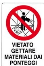
Vietato gettare materiali dai ponteggi