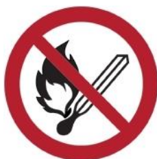
P003 - Vietato usare fiamme libere