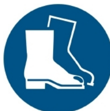
M008 - Indossare calzature di sicurezza