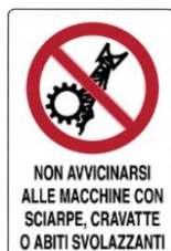
Vietato avvicinarsi alle macchine utensili con vestiti svolazzanti