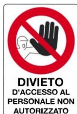
Divieto d'accesso al personale non autorizzato