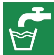
E015 - Acqua potabile