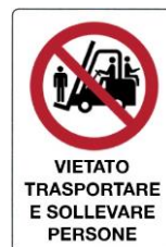
Vietato trasportare e sollevare persone