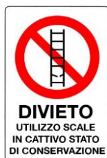
Divieto di utilizzo scale in cattivo stato di conservazione