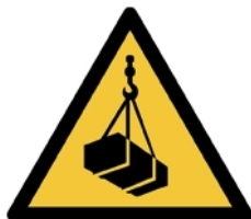
W015 - Carichi sospesi