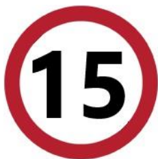
Velocità massima in cantiere di 15 km/h