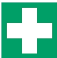
E003 - Pronto soccorso