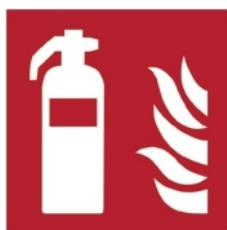
F001 - Estintore

ponteggi senza l'utilizzo delle apposite scale