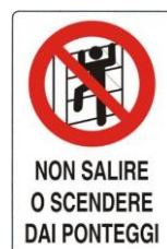
Vietato salire o scendere dai