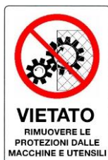
Vietato rimuovere le protezioni dalle macchine e utensili