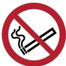
P002 - Vietato fumare