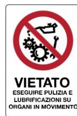
Vietato eseguire pulizia, riparazioni e lubrificazioni su organi in movimento