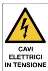
Cavi elettrici in tensione