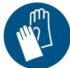
M009 - Indossare guanti protettivi